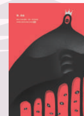
致。自由 學生組佳作 廖建凱

1984年，聯合國通過《禁止酷刑及其他殘忍不人道或有辱人格之待遇或處罰公約》（簡稱「禁酷公約」），截至目前為止已有173個國家加入批准，未來期許禁酷公約施行法草案儘快在立法院審議通過，杜絕各種形式的酷刑及虐待在台灣發生。