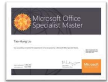
微軟 MOS 國際認證電子證書樣式