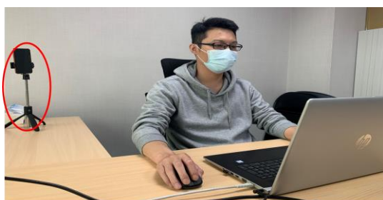
測驗期間需全程開啟視訊及麥克風，並將把手機放置於您坐定的座位斜後方的平台四點鐘或八點鐘方向