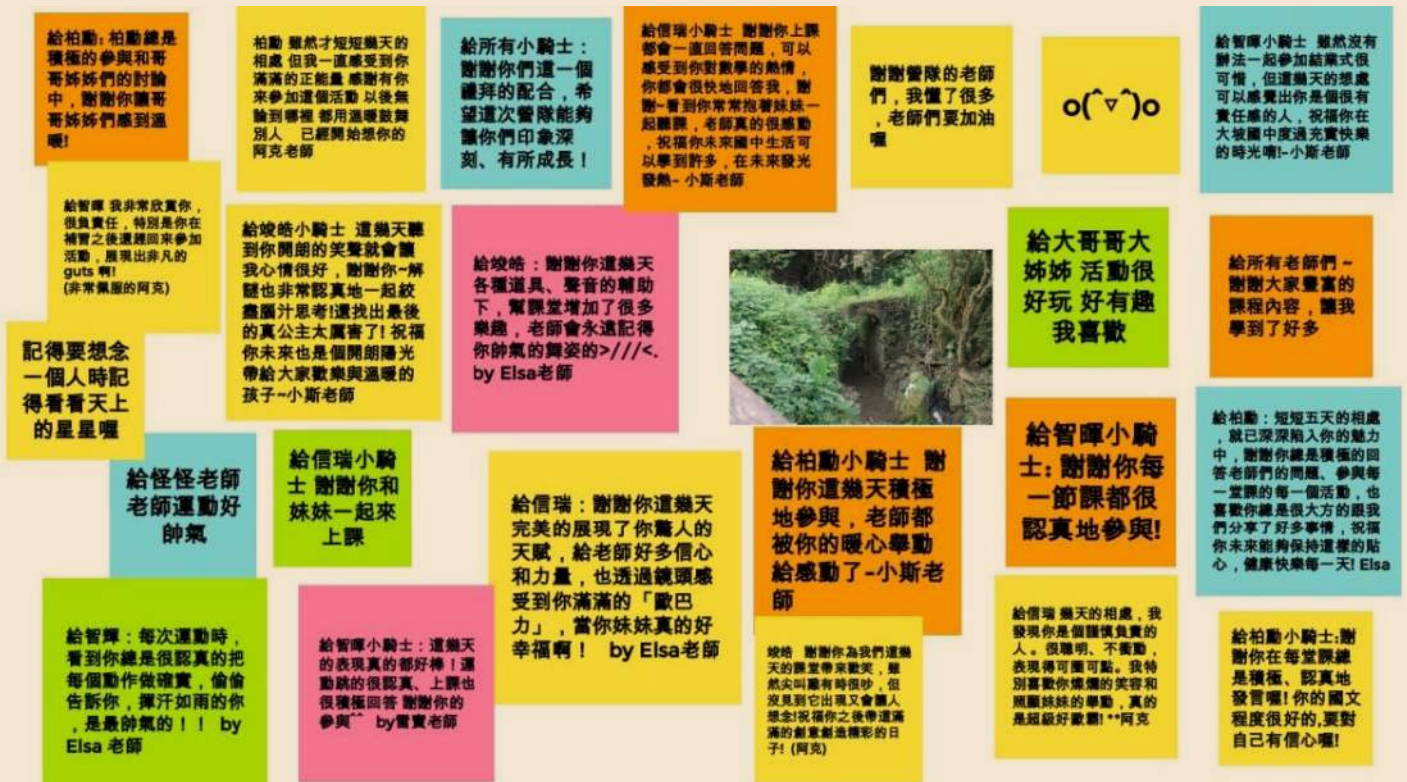
▲ 小騎士留言板 - 大哥哥大姐姐和學生們留下對彼此的話

林老師談到在這幾年的觀察中發現，社會進步勢必帶著區域發展不平衡的代價，如何縮短城鄉差距也成了社會的考驗。其實很多偏鄉學校的電腦硬體設備都比都市還要好，因為社會投資了許多在偏鄉學校的基礎建設上，對於現今的社會而言， 地理的限制已不再是阻擋學習的門檻 。老師也提出了兩個關於偏鄉教育解決方法：第一個是利用 資訊科技將教學資源導入 ，例如遠距教學，成為最直接簡單的幫助，我們應該教導孩子如何善用電腦，不單單只是如何操作 word 等文書處理，更重要的是如何運用網路搜尋，找到自己學習上所需的資源，現在網路上有許多免費且優質的學習平台可供任何人使用，我們應 培養孩子自主學習的能力 ，學會如何妥善運用豐富的學習資源。另一方面，現實上增加師資的困難，可以由第二個管道來解決：大學的師培課程， 將大學資源導進偏鄉 ，同時補足了大學缺乏的實作經驗，以及偏鄉所需要的教學資源，相輔相成。漸漸地讓偏鄉的孩子有多一點的學習機會與管道，期望能擁有不輸給都市孩子的學習經驗和資源，讓資源平等分布，讓孩子們都能擁有同等的機會實現夢想！