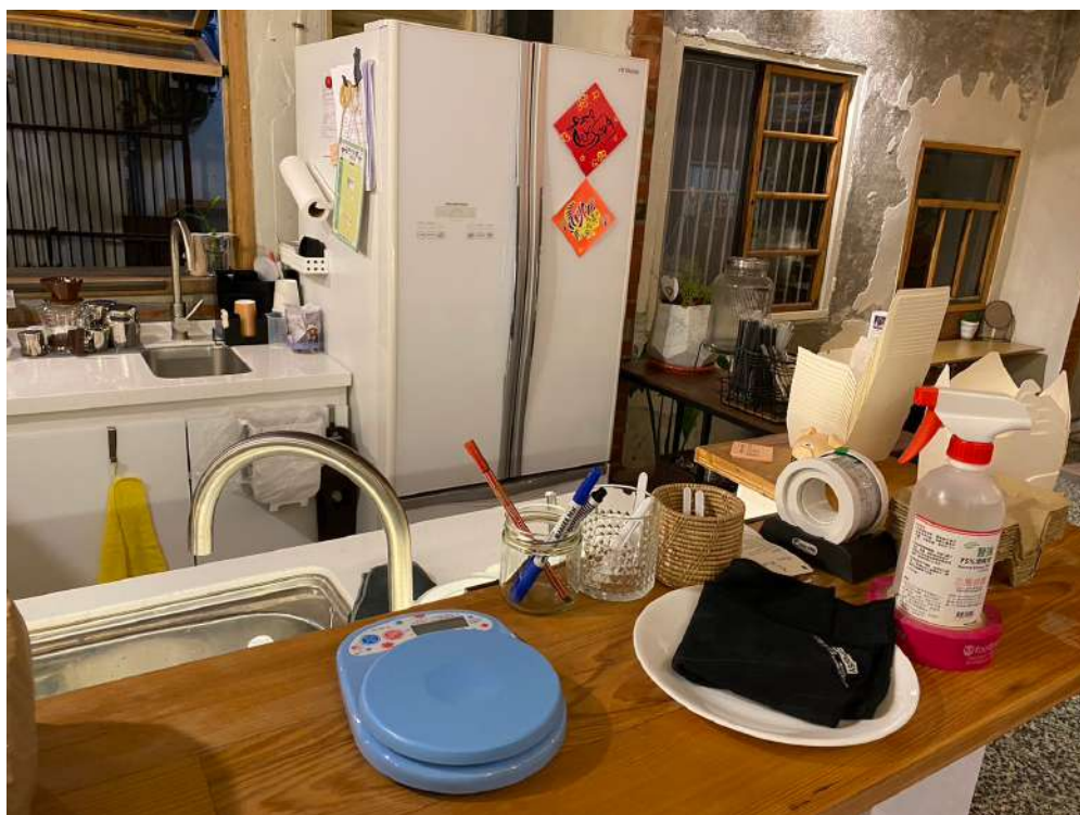
◀ 店內使用家用冰箱而非甜點櫃

大觀小弄是一間注重環保議題的店家，店內的甜點包裝都是堅持用紙餐盒進行減塑，而且大觀小弄沒有「甜點櫃」。有些顧客進到店內也會好奇為甚麼沒有安裝甜點櫃，讓人可以輕易挑選自己想吃的款式。老闆表示，因為甜點櫃的耗電量是一般家電冰箱的好幾倍，如果今天為了美觀使用甜點櫃，將會造成很大的能源消耗，這不是店家所樂見的。因此，即使今天顧客必須使用手機觀看IG的限時動態來挑選喜歡的產品，老闆還是覺得，如果能因此減少些許耗能，一切都是有意義的。老闆在採訪中跟小記者說道：「 有些東西它其實是一個選擇，不能讓每個人都去配合你的價值觀。 」推廣議題不能硬性地要求他人跟進，如果不能讓對方也瞭解到其中的意義，即使今天對方在我們眼前乖乖遵守，離開視線後他們逆著做了多少回我們都不知道。因此，老闆表示不會強迫他人跟著自己的環保理念走，但會用在店內的環保行動讓對方知道自己有這個選擇，用靜態的方式招來同道中人，就像姜太公釣魚一般。