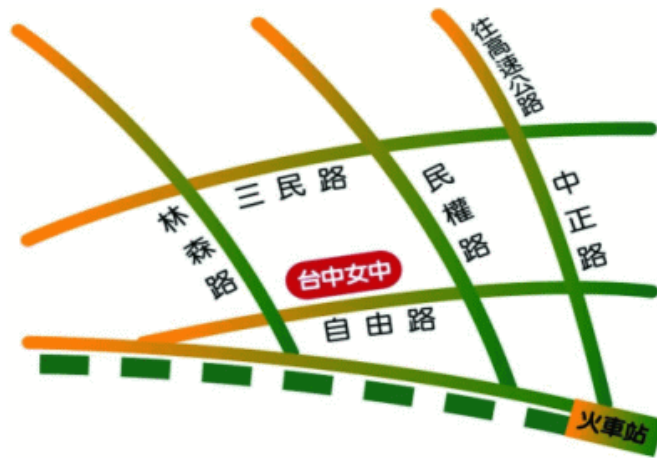
臺中市立臺中女子高級中等學校 110 學年度校園配置圖