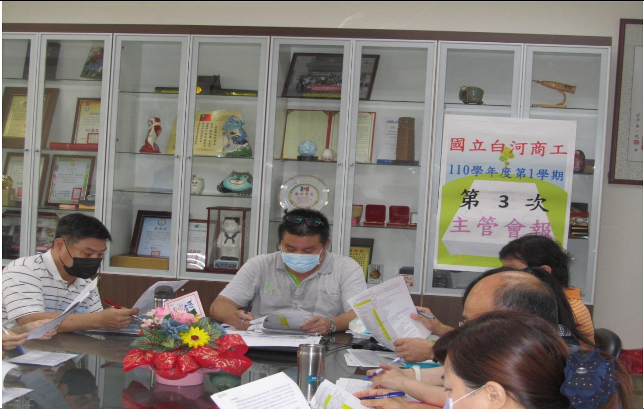
國立白河商工 110 學年度第 1 學期第 3 次主管會報 校長監督經費執行