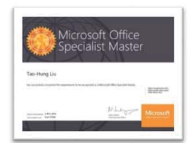
MOS 2010、MOS 2013、MOS 2016 原廠認證版本考試資訊