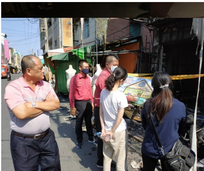
圖四、災後訪視照片